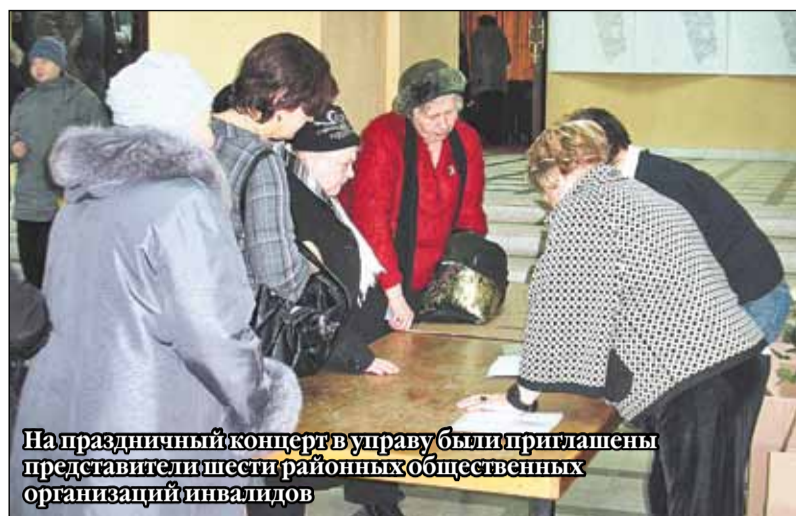
На праздничный концерт в управу были приглашены представители шести районных общественных организаций инвалидов